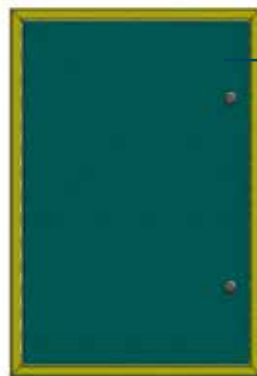
Front of view of inspection hatch