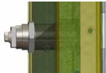
Sectional view of the lock